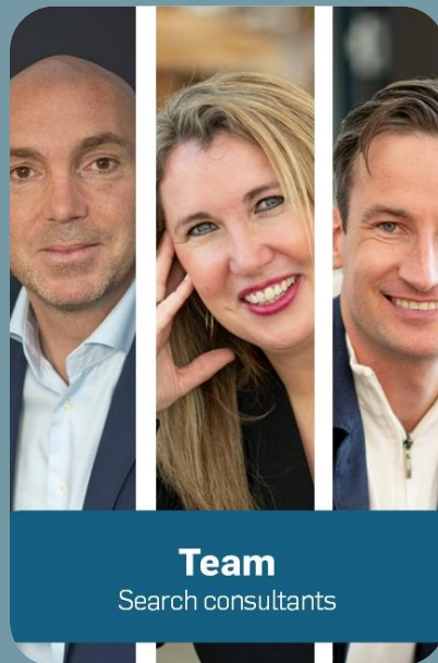
Team Search consultants