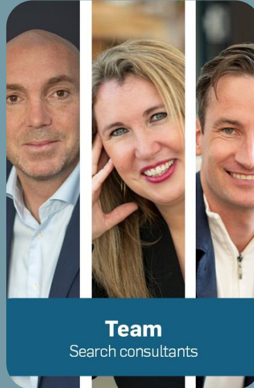
Team Search consultants