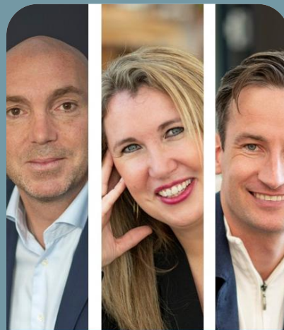
Team Search consultants