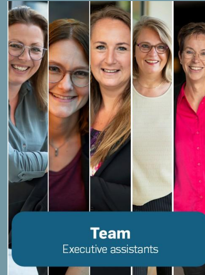
Team Executive assistants

Volkshuisvesting Arnhem werkt samen met whyz bij de search voor een lid raad van commissarissen.