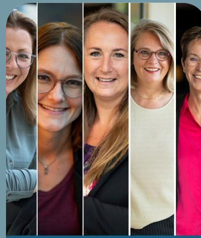
Team Executive assistants

De Huismeesters werkt samen met whyz executive search & interim bij deze searchopdracht.