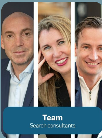
Team Search consultants